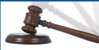
Změna občanského zákoníku