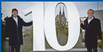
Historie společnosti Allrisk