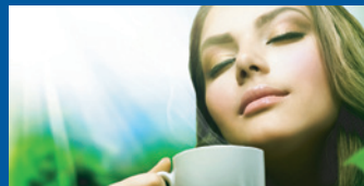
Čaj vás nejen osvěží