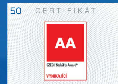
Ocenění pro Allrisk