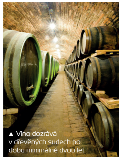
▲ Víno dozrává v dřevěných sudech po dobu minimálně dvou let

naturels, například pro Muscat de Beaumes de Venise, se dodává ve stadiu časnějším.